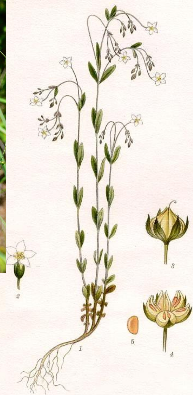
VILDLIN, LINUM CATHARTICUM L.